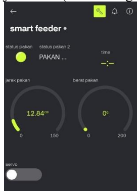
Gambar 3. 3 Tampilan Antarmuka Blynk IoT

Antarmuka tersebut memungkinkan pengguna untuk melakukan pemantauan sekaligus kendali jarak jauh dengan koneksi internet.