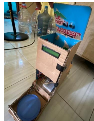
Gambar 4. 1 Implementasi Fisik Smart Feeder

Gambar 4.1 berikut menunjukkan hasil akhir rancangan smart feeder yang telah dirakit.